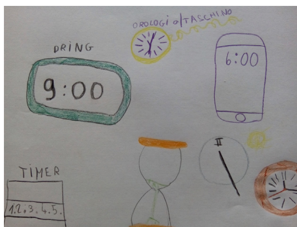
Figura 1 Una rappresentazione spontanea degli strumenti di misurazione del tempo.

Il contributo prevede una prima parte d'inquadramento teorico, una sintesi della ricerca svolta e infine una descrizione delle possibili attività da svolgere in classe.