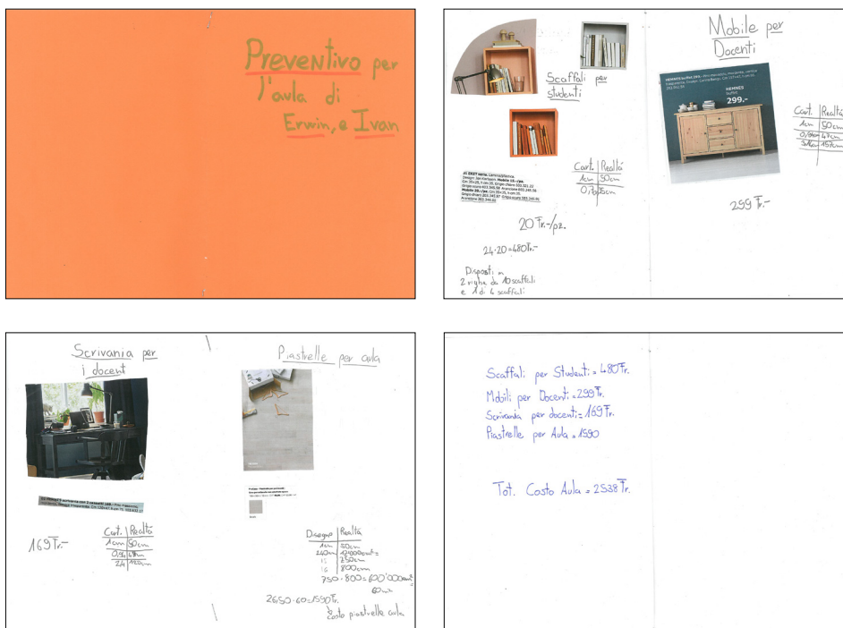
Figura 1 Un esempio di preventivo completo.