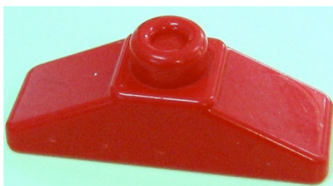
Figura 2 Mattoncino Lego per le fasi 5 e 6.