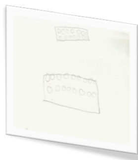
Figura 7 Prima e seconda rappresentazione del mattoncino blu da parte di Gabriele.

percorso sperimentale), l'altro, quello più in alto, si riferisce invece a quello prodotto, sempre da Gabriele, durante l'intervista (fase 4) riportata, seppur in parte, di seguito.