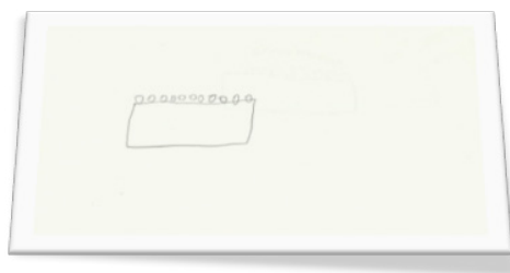
Figura 3 Il mattoncino blu della fase 3, rappresentato da Dario.

Nel disegno prodotto e mostrato in sezione (durante la fase 3, Figura 3), Dario ha tracciato una forma rettangolare con 11 pallini disposti in un'unica fila. La visione del mattoncino appare frontale come in realtà era la sua posizione in sezione rispetto al mattoncino stesso.