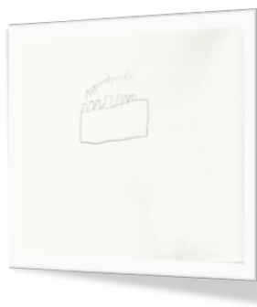
Figura 4 Seconda rappresentazione del mattoncino blu da parte di Dario.

In questa seconda rappresentazione figurale, riportata in Figura 4, viene tracciata (in modo più o meno fedele a quella riportata sul primo disegno da lui prodotto) la forma rettangolare. A differenza di quanto prodotto in precedenza vi è però, come chiaramente verbalizzato da Dario, un tentativo di disporre le punte presenti sul mattoncino blu in due file differenti. Le punte disegnate sono però inaspettatamente 8 per la prima fila e 13 nella seconda fila ed è inoltre assente una relazione di parallelismo tra le due file di punte. Ciò non deve stupire, il compito richiesto è molto complesso, lo sforzo cognitivo è alto. Una linea di punte viene disegnata da Dario lontana dalla base di appoggio, forse per dar un senso di profondità che però, chiaramente, il bambino nel suo disegno gestisce in modo ancora insicuro.