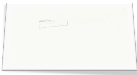
Figura 5 Il mattoncino della fase 3, rappresentato da Giulia.

Anche il disegno proposto da Giulia nella terza fase riporta una forma rettangolare sulla quale vengono posizionati dei cerchietti in linea.