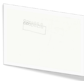
Figura 6 Seconda rappresentazione del mattoncino blu da parte di Giulia.

Nel nuovo disegno (Figura 6) che riproduce in un altro foglio bianco, il rettangolo questa volta è più regolare e le punte, anche se sono 14 e non 12, vengono distribuite equamente sul lato superiore del rettangolo.