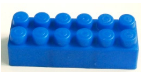
Figura 1 Mattoncino Lego per la fase 3.

Per il compito proposto viene scelto il mattoncino Lego riportato sotto (Figura 1). Come per la fase 0 ogni bambino inizialmente osserva (attraverso la manipolazione libera) il mattoncino blu provando a coglierne la forma, la presenza di spigoli, di “punte”, la loro numerosità ecc. In un secondo momento il mattoncino viene posto sul banco e i bambini disegnatori si siedono in linea davanti a questo. Il setting proposto viene scelto per favorire nei bambini più punti di vista di osservazione, legati alla loro posizione spaziale. Si cerca di favorire la produzione di disegni dello stesso oggetto, ma con prospettive diverse.