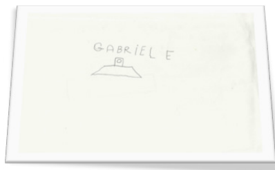
Figura 9 Seconda rappresentazione del mattoncino rosso da parte di Gabriele.

Il trattamento operato (riportato accanto) mette in evidenza un disegno simile al primo ma con una caratteristica in più: «questo ha la forma dello scivolo e questo pure» (indicando i due lati dell'oggetto tridimensionale).